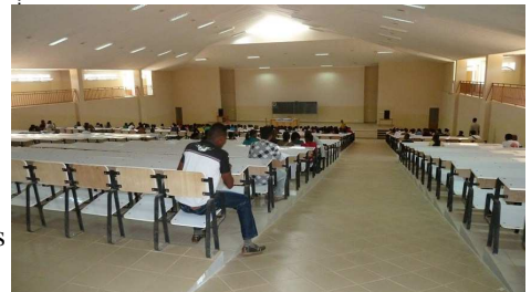
Le grand amphi de l'université

Le groupe organise pour le week-end de pentecôte, un séjour en camping vers Mananjara sur la côte est de Madagascar. Au cours de ce voyage, diverses visites éducatives seront programmées. L'important est que les étudiants gèrent complètement l'activité : programme, réservations, finances etc... pour développer chez eux le sens de l'organisation.